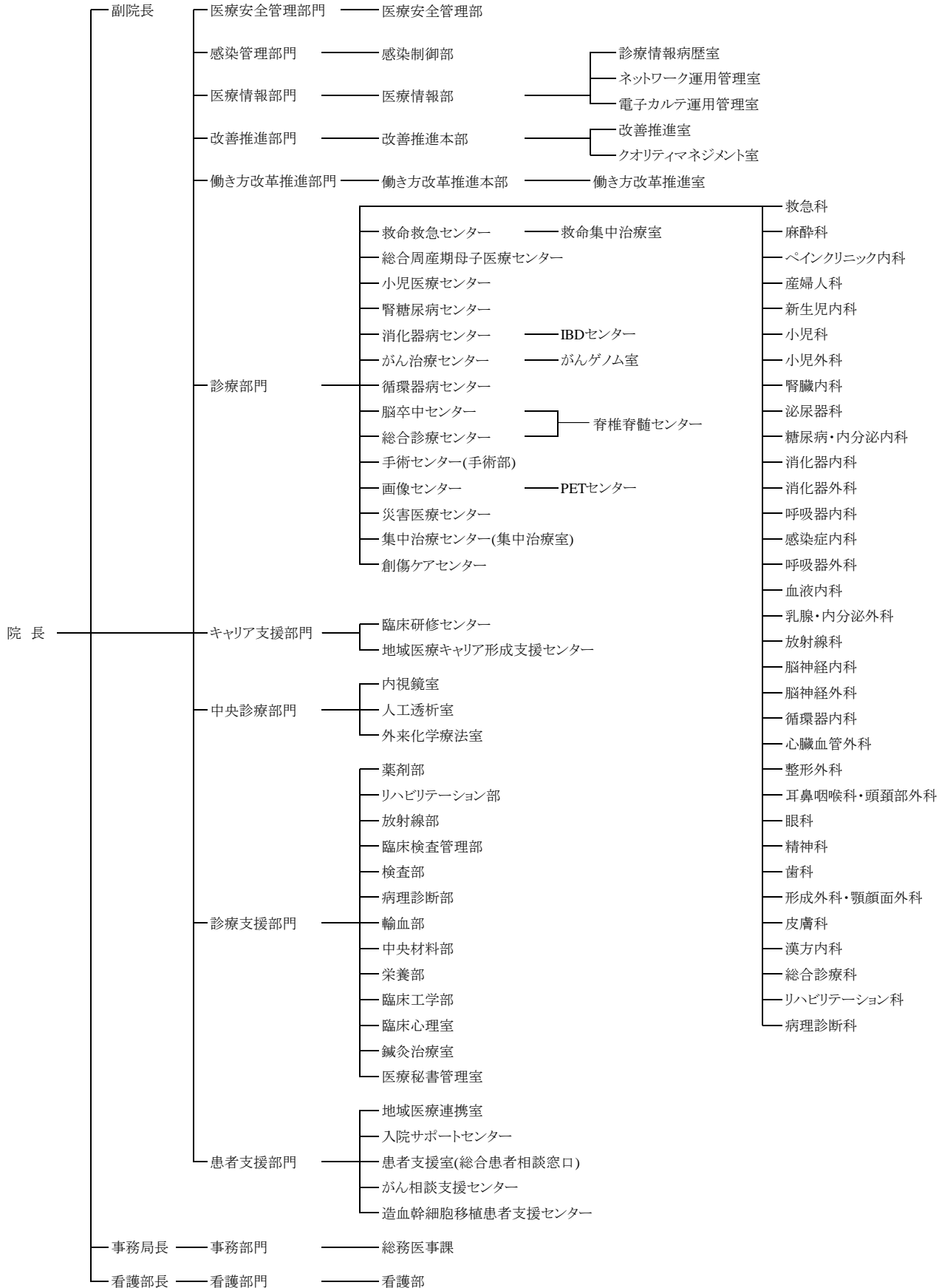
■ 組織図(院内標榜 2023年4月1日現在)