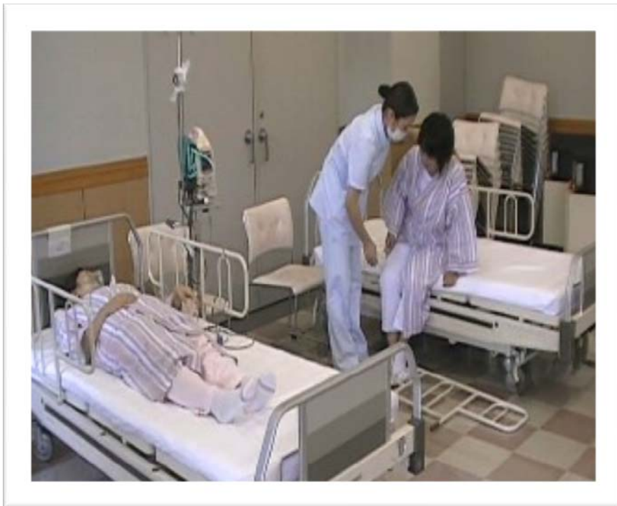
新規採用者研修風景（多重課題）