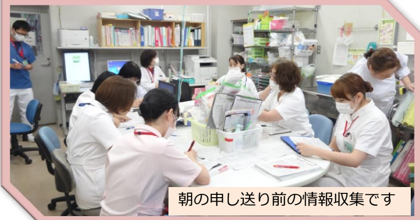
朝の申し送り前の情報収集です

愛南町の高齢化に伴い、入院して来られる方も高齢の方が多く、認知症を初め様々な合併症で入退院を繰り返す方も少なくありません。出来る限り住み慣れたご自宅や地域に退院していただけるように、総合診療・地域包括支援センターと協力し、ご家族・地域のケアマネージャーやあらゆる職種の方々とも話し合いを進め、退院支援できるように取り組んでいます。