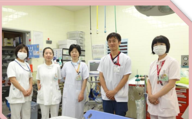
救命救急士の実習にも協力しています

4階東病棟は、今年度の組織編成により病棟業務と救急外来業務を担う部署になり、看護長・スタッフ・看護助手を含め、33人の大所帯となりました。両方の業務を習得するために奮闘中です。