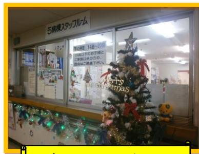
スタッフステーション